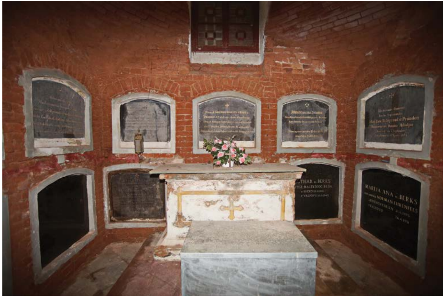
Sl. 4. Interijer kripe – Pogled na izvorni oltar

U ograđenom dijelu zemljišta oko kapelice stoje dva groba. U prvom grobu, koji je ograđen ukrasnom providnom željeznom ogradom visine oko 60 centimetara, prema natpisu na njemačkom jeziku, pokopan je brat grofa Rudolfa I. Normann-Ehrenselsa, Karl grof Normann-Ehrensels, kaplar petog konjaničkog puka, koji je umro u 18. godini života, 10.