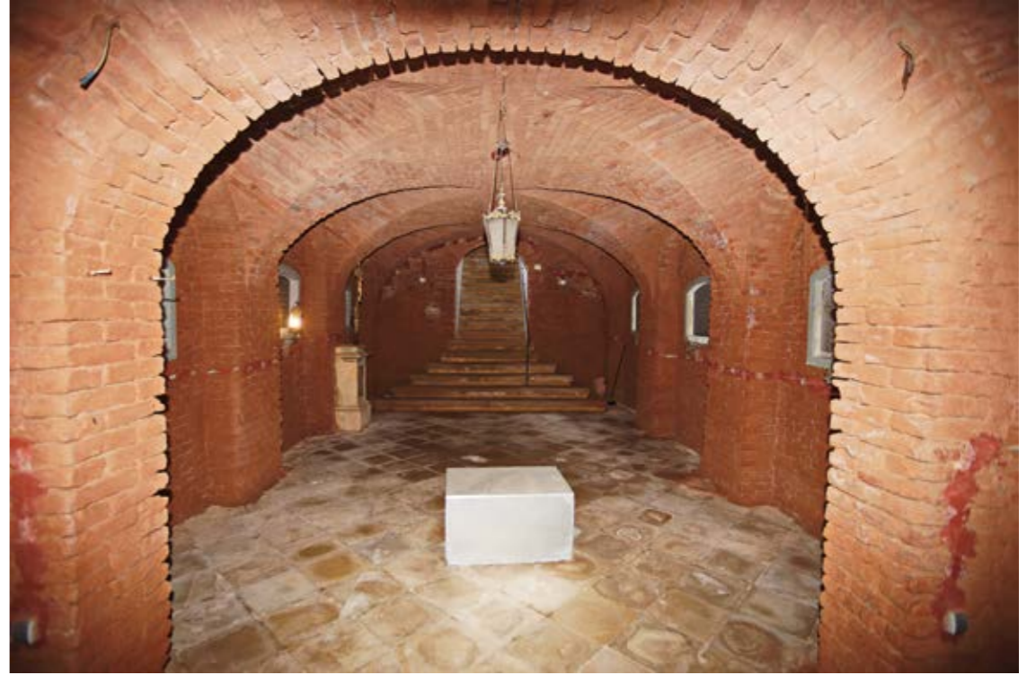
Sl. 3. Interijer kripe – Pogled s oltara

je osnovan prvi Memorijalni centar Podunavskih Švaba u Hrvatskoj u spomen na pripadnike njemačke i austrijske manjine koje je nakon Drugog svjetskog rata jugoslavenska komunistička vlast otjerala u logore smrti, gdje je nad njima provođen genocid od 1945. do 1948. godine. 1 Jedan od takvih logora bio je i onaj u Valpovu, kroz koji je, tijekom 1945. i 1946. godine, prošlo oko 3.500 osoba, od kojih je život izgubilo njih 1.500.