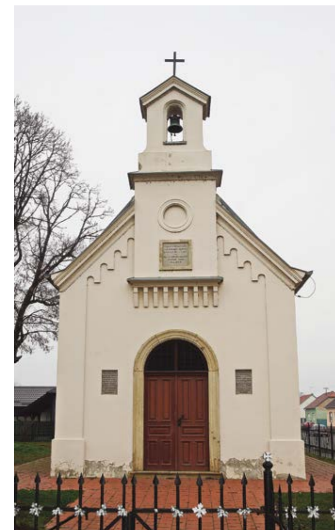
Sl. 1. Kapelica sv. Roka u Valpovu